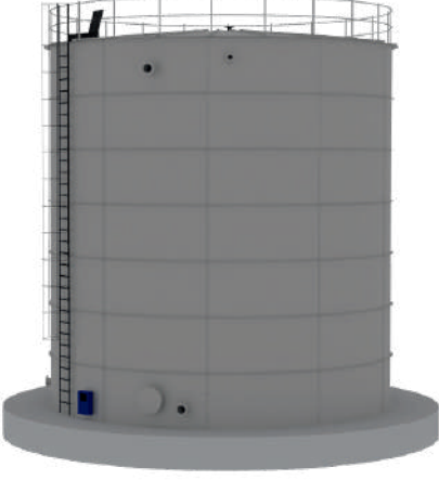
ÖRNEK RESİM : BKS-107