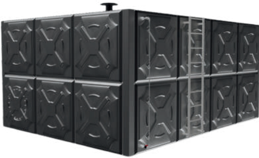
ÖRNEK RESİM : IMD-3-4-2 (İÇTEN TAKVİYELİ)