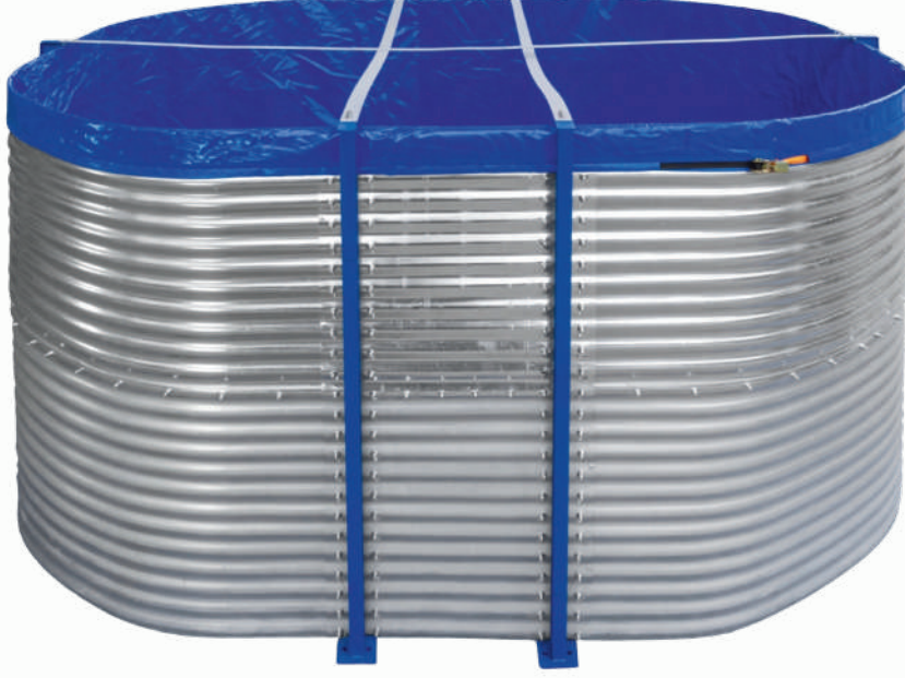
ÖRNEK RESİM : EM