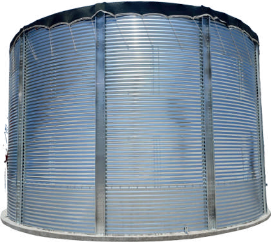
ÖRNEK RESİM : MS