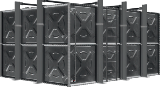
ÖRNEK RESİM : YMD-3-4-2 (DIŞTAN TAKVİYELİ)