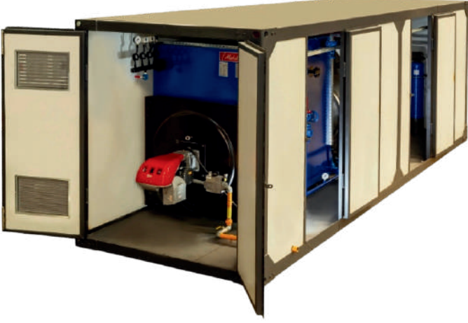
ÖRNEK RESİM : KMBS