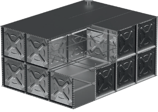
ÖRNEK RESİM : BMD-3-4-2 (İÇTEN TAKVİYELİ)