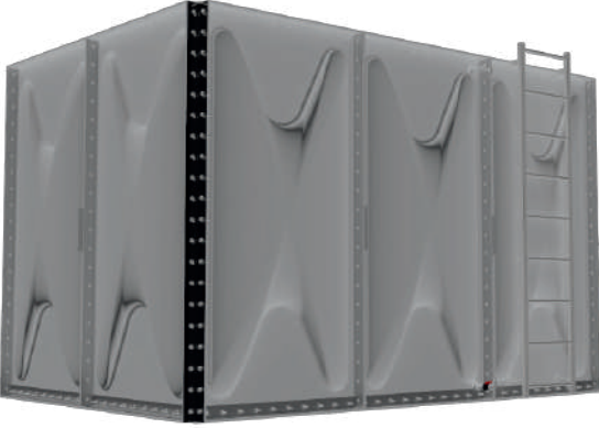
ÖRNEK RESİM : GRP-2-3-2 (İÇTEN TAKVİYELİ)