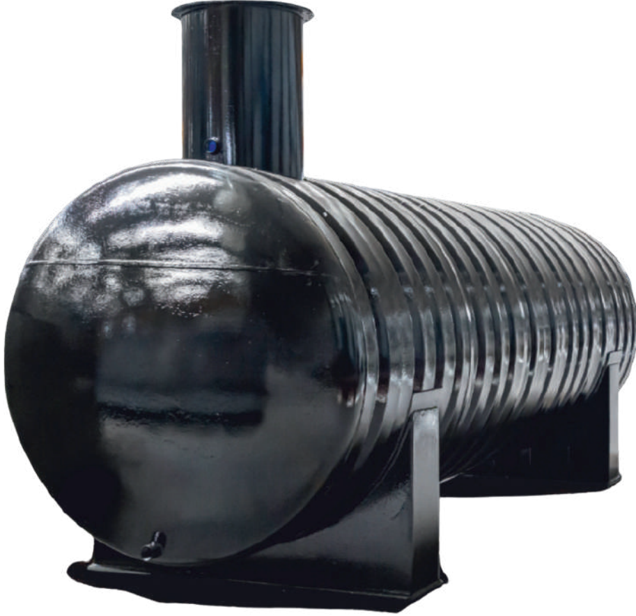
ÖRNEK RESİM : YAYT