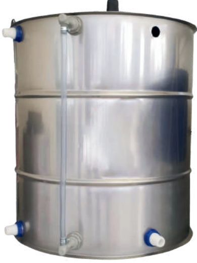
ÖRNEK RESİM : KGPD-250