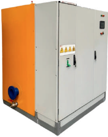
ÖRNEK RESİM : ESSK